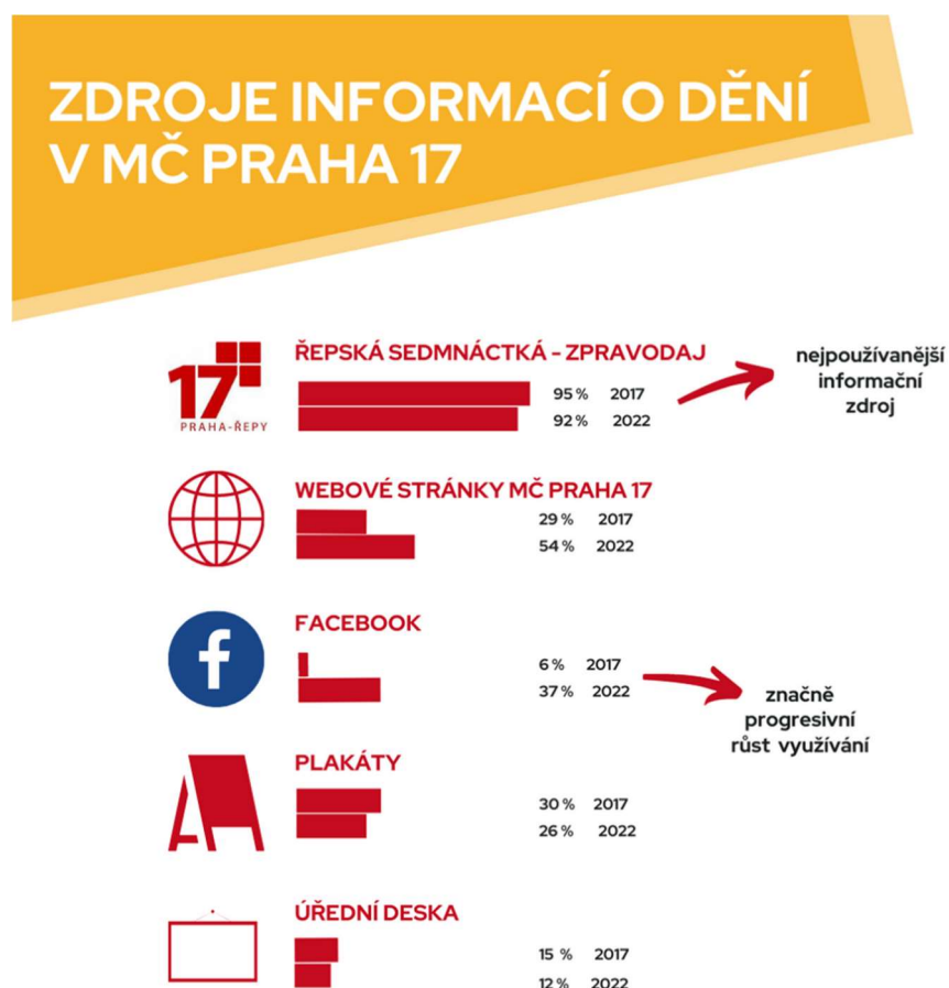
Obrázek 4: Zdroje informací o aktuálním dění v MČ Praha 17

Pozn. Uveden procentuální podíl respondentů, kteří daný zdroj uvedli.