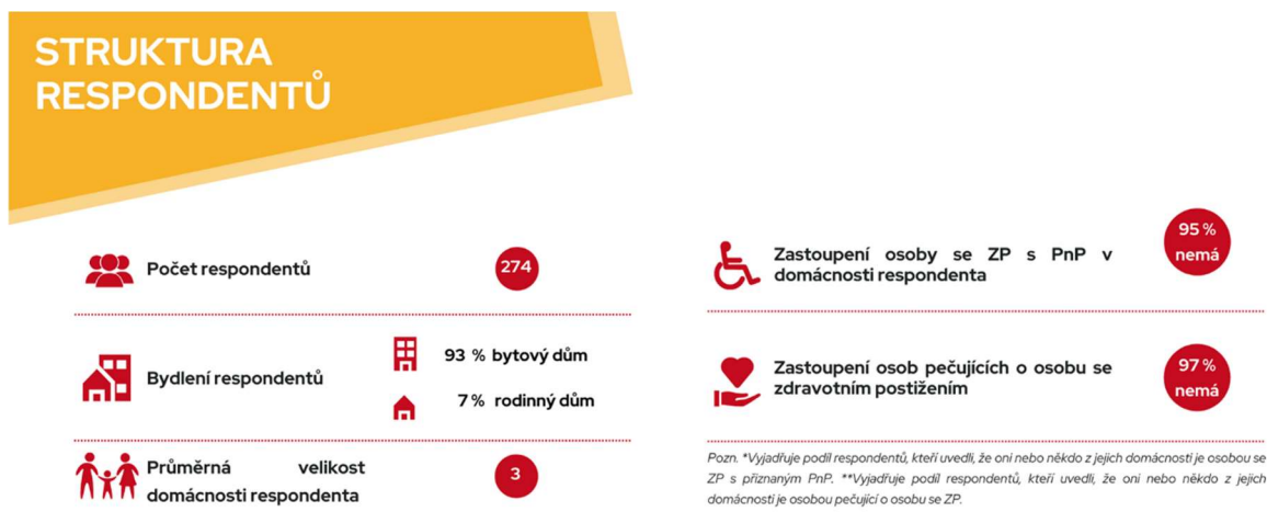
Obrázek 1: Struktura respondentů