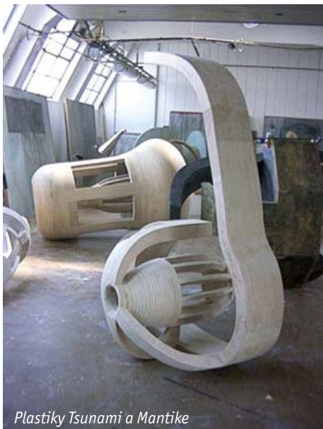
Plastiky Tsunami a Mantike

Když vyjdete na ulici, tak okamžitě vaše smysly zaujme spousta věcí – barvy, tvary, zpěv ptáků... Člověk si to ovšem nevykládá jako umění. Kdyby ale všechno kolem bylo prázdné a šedivé, tak by měl okamžitě potřebu najít něco, co by mu to,