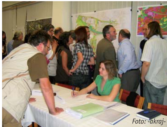
Po ukončení 2. veřejného projednávání Územní studie Řepy byly mapy v obležení.

Městská část Praha 17 podává na Magistrát hl. m. Prahy požadavek na změny územního plánu. Změny se týkají pozemků, jejichž současné funkční využití neplní svůj účel. Vzhledem k rozvoji městské části by bylo třeba je funkčně změnit, aby bylo možno v souladu s plánem investic,