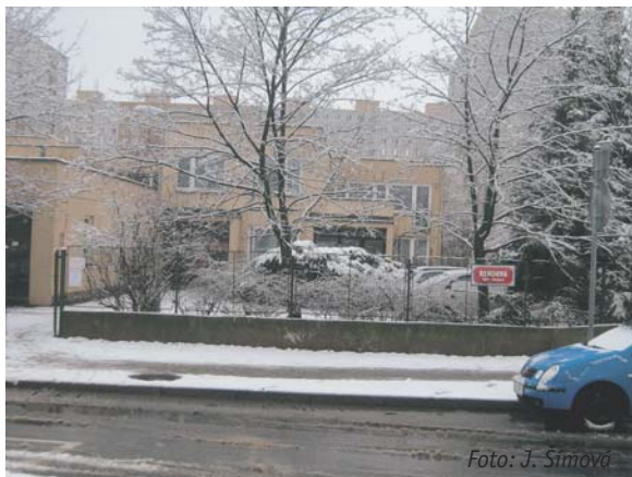
V Bendově ulici je jedno z odloučených pracovišť ÚMČ Praha 17.