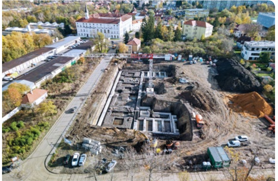
Pohled z výšky na výstavbu DPS. Vlevo nahoře Domov sv. Karla Boromejského.

Dům s pečovatelskou službou (DPS) zatím roste pod úrovní země. Po zemních pracích a hloubení jámy pro základy v současné době stavební firma provádí jejich betonování. Následně dojde k položení základové desky v prvním podzemním podlaží, jak se přesvědčilo vedení MČ Praha 17 při pravidelném kontrolním dnu 9. listopadu 2023.