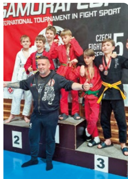
Děti z klubu Tiger Gym se v říjnu účastnily mezinárodních závodů Samurai Cup, na kterých za své výkony získaly tři bronzové medaile a jednu zlatou.

Bojové sporty jsou nyní populární. I díky tomu se v Tiger Gym za poslední měsíce rozšířila členská základna o dvě stě členů, nyní jich je přes šest set. To se podle Jana Klímy po letních prázdninách děje pravidelně, záleží ale na tom, kolik klientů u bojových umění nakonec zůstane.