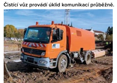
Čistící vůz provádí úklid komunikací průběžně.