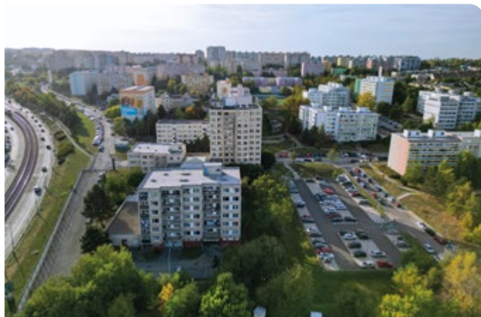
Přestavbou hotelu Fortuna West a ubytovny (uprostřed) má vzniknout bytový komplex se 153 převážně malometrážními byty a se 152 parkovacími stáními pro účely majitelů bytů. V předchozích letech MČ Praha 17 řešila nedostatek parkovacích stání v lokalitě vybudováním parkoviště s kapacitou 104 parkovacích stání.

Provoz hotelu Fortuna West byl v minulosti opakovaně kritizován kvůli rušení nočního klidu ze strany hotelových hostů, nebo bezohledným odstavováním dálkových autobusů v přeplněných ulicích v jeho okolí. V současné době je objekt nevyužíván. Projekt počítá s přebudováním hotelu a ubytovny na bytové domy. Investor počítá pouze s přestavbou a vyhnul by se tak placení investičního příspěvku do rozpočtu městské části. Obešel by tak platná pravidla, která vychází z pravidel schválených Magistrátem