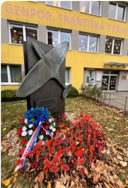
Žáci základní školy genpor. Františka Peřiny své „vlčí máky“ ke Dni válečných veteránů umístili i k památníku před školou.