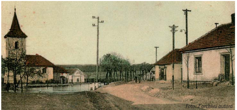
Kostel sv. Martina s dnes již neexistujícím rybníkem. Foto z roku 1929 – dnešní ulice Žalanského byla tehdy ještě prašnou cestou.

Událostí číslo jedna však bylo právě Martinské posvícení. Pamětníci nadšeně vzpomínají: „Za první republiky se tančilo a hrálo i ve dvou či třech hospodách najednou a my jsme o posvícení přecházeli z jedné do druhé. Tančilo se v sobotu, v neděli po kostele a po obědě, a aby toho nebylo málo, tak vytrvalci tančili také v pondělí o pěkné a v úterý o sousedské.“ Nezbývá nám, než jim tuto krásnou dobu závidět. Mnozí obyvatelé nových Řep již tuto tradici nechtějí a možná ani neznají. Na otázku, zda vědí, kdy naše obec slaví posvícení, mnozí „náctiletí“ pouze krčí rameny. A tak nezbytné připomenutí: Řepské posvícení se slaví 11. listopadu