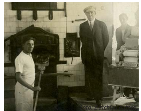
Pekárna u Sedláčků – mistr pekařský dohlíží, aby se koláče nepřipálily.