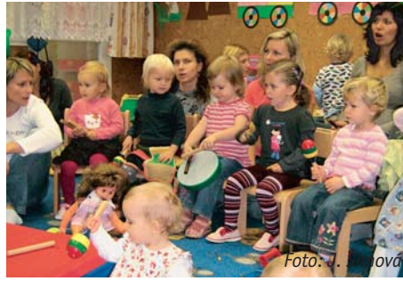
Ve středu bývá přeplněno...

Mateřské centrum Řepík najdete v ulici Bendova 1121/5, Praha-Řepy (mezi MŠ Bendova a MŠ Pastelka v objektu Centra sociálně zdravotních slu-