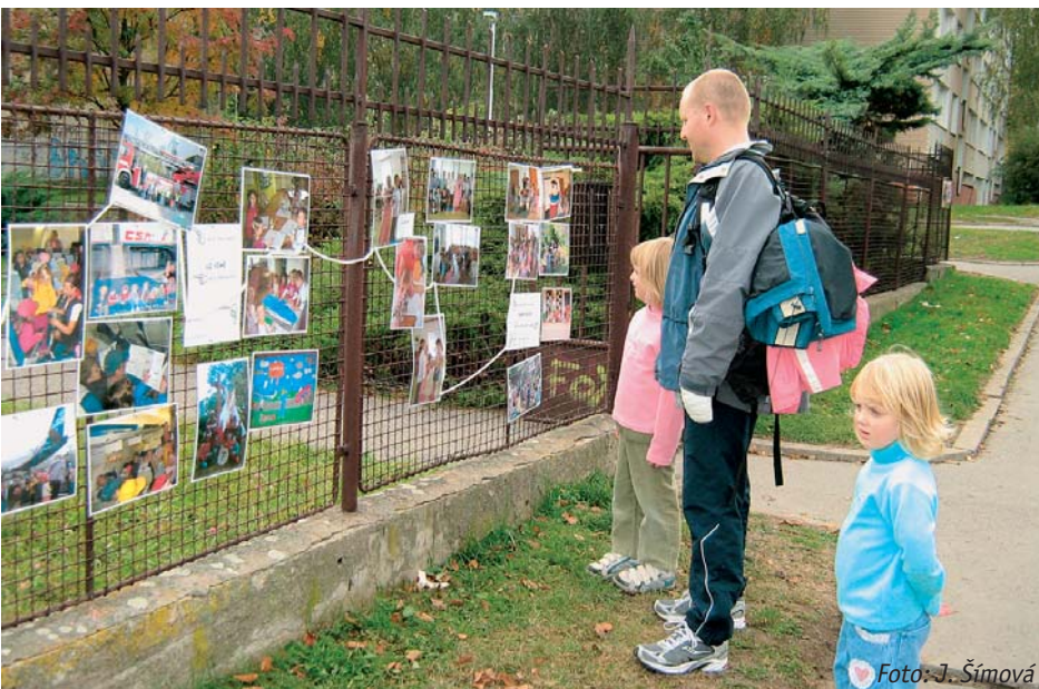
Výstava na plotě – MŠ se speciálními vadami v ul. Laudova uspořádala na přelomu září a října výstavu fotografií dokumentujících společné aktivity dětí zdravých i postižených.